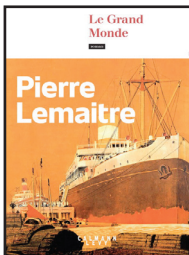
LE GRAND MONDE Pierre Lemaitre