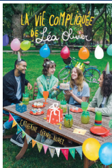
LA VIE COMPLIQUÉE DE LÉA OLIVIER - BONNE FÊTE LÉA Catherine Girard-Audet