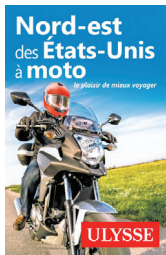
NORD-EST DES ÉTATS-UNIS À MOTO JULYSSE