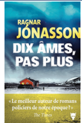
DIX ÂMES, PAS PLUS Ragnar Jonasson